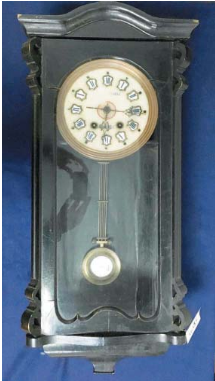
Настенные часы Московской фирмы Моргуновых. Конец XIX в. НМ РТ, инв. № 16453