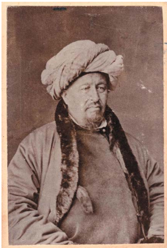
Фотография Ш. Марджани. Фотостудия Г.Ф. Локке. 1874 г. НМ РТ, инв. № 24634