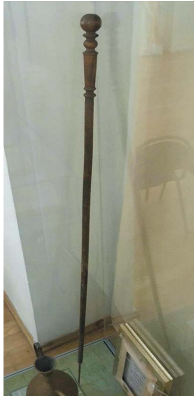
Посох – палка для проповеди имама Ш. Марджани. НМ РТ, инв. № 8574