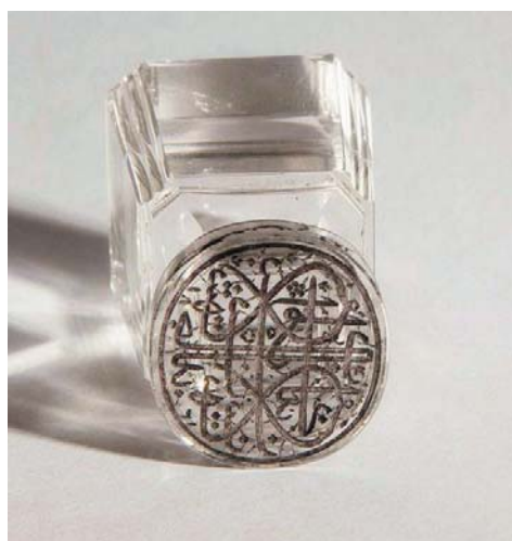
Личная печать Ш. Марджани. НМ РТ, инв. № 16149