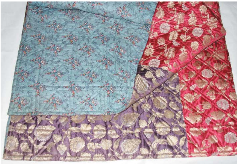
Парчовое одеяло (подстил под скатерть для чайной церемонии по-мусульмански – «дастархан»). НМ РТ, инв. № 16420