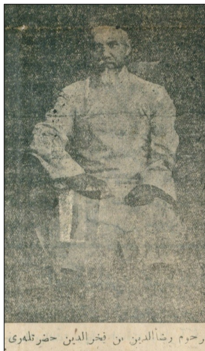
Рәсем 2. «Милли байрак» газетасының 257 номеры (1941 елның 44 апреле).