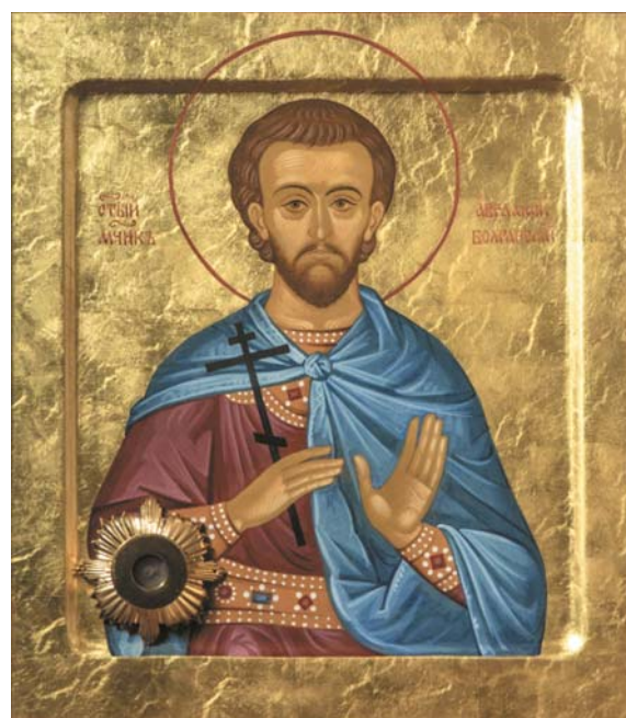
Икона с мощевиком Авраамия Болгарского. URL: https://vagankovo.net/wp-content/uploads/2018/09/avraamij-novyj.jpg (дата обращения: 10.05.2023).

Интерес представляют сведения о жителях Волжской Булгарии, причисленных после их смерти по православной традиции к лику святых. Наиболее ранним и известным христианином, уроженцем данного государства, болгаротатарин по национальности и святым Русской православной церкви является Авраамий Болгарский. Сведения о нем дошли благодаря его Житию. Авраамий