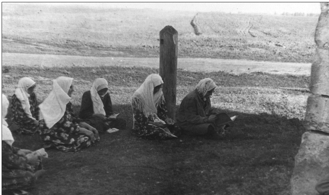
Татарские мусульманские паломницы на Болгарском городище. Начало 1960-х гг. Научный фонд Музея археологии РТ Института археологии им. А.Х. Халикова АН РТ.

Наконец, вот как сама императрица Екатерина II описала встречу с татарскими паломниками в Болгарах в письме к Вольтеру от 11/22 ноября 1772 года. «В продолжении моего по Волге путешествия сошла Я с своей галеры на берег, в 20 верстах ниже города Казани, с тем, чтобы посмотреть остатки древнего Булгара, города, построенного Тамерланом для своего внука. В самом деле, нашла Я там семь или восемь каменных домов, и столько же минарет, весьма прочно построенных. Я приближалась к одной развалине, подле которой стояло человек сорок Татар. Тамошний Губернатор объявил Мне, что на это место сии люди приходят молиться, и что находившиеся у меня в виду пришли туда из дальних мест. Мне захотелось узнать, в чем состоит их богомолие, и для того спросила о том у одного из Татар, коего вид Мне показался умнее прочих; но он, дав Мне знаками разуметь, что Российского языка не знает, побежал позвать одного человека, которой в нескольких шагах от нас находился. Как он подошел, то спросила Я его: кто он таков, и узнала, что он Иман, который по-русски говорил довольно хорошо. Он Мне объявил, что в той развалине обитал некоторый святой жизни человек, и что они из весьма дальних мест пришли для принесения над гробом его молитв. То, что Я от него услышала, заставило Меня заключить, что и их почтение к Святым очень близко подходит к Нашему» (Переписка, 1802).