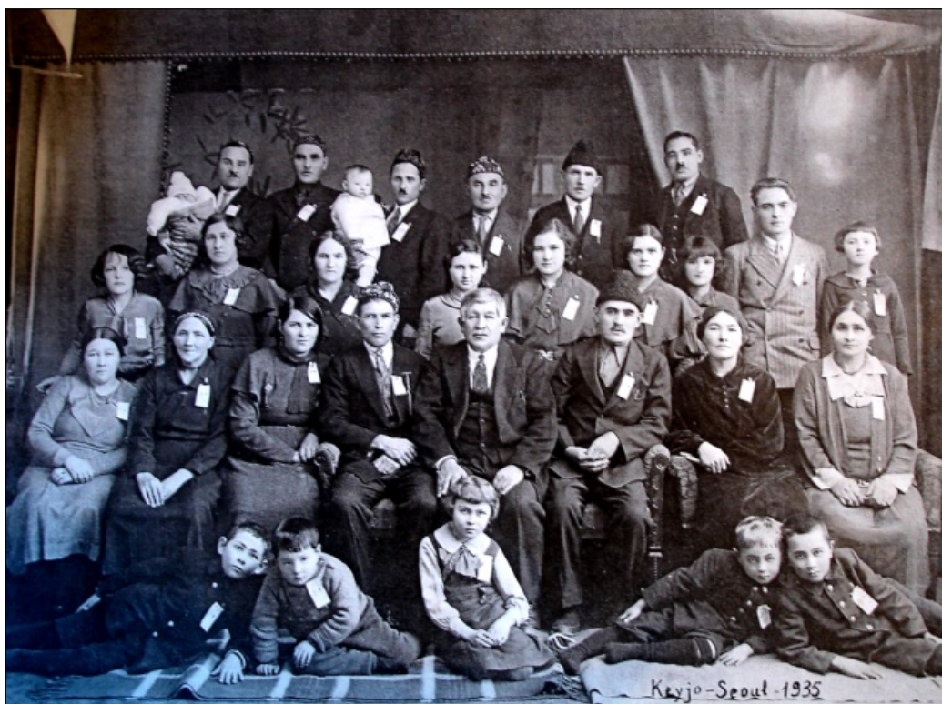
Рәс. 4. Кижү татарларының Г.Исхакый белән очрашулары (Usmanova, 2007)

соңгы эшчәнлеген бу чыганактан белә алмыйбыз. Кызганычка каршы, аның тарихы өзелә. Бу 1945 елда Кореяның япон карамагынан азат ителүе һәм икегә (Көнъяк һәм Төнъяк) бүленеп, ике якның бер-берсенә каршы сугыш башлавы белән бәйлә. Кореяга килеп төпләнгән татарлар элгә афәтләрдән котылып өчен, төзөгән биналарын, йортларын, ачкан сәүдәләрен һәм жайлашкан тормышларын ташлап, яңадан дөнъяның төрле почмакларына сибелергә мәжбүр булалар. Мөгаен, «Ногмания» мәчет-мәктәбе дә бу дулкын астына эләккәндер.