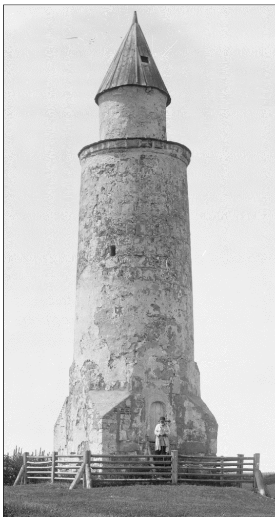
Татарский мусульманский паломник у входа в Малый минарет Болгарского городища. 2–3 июня 1912 г. (Абдуллин и др., 2016: 77).

О значимости для мусульман Малого минарета в Болгарах упоминает И.Н. Березин: «Остатки здания на западе носят тот же характер. Вообще эти здания ни способом постройки, ни архитектурой не отличаются от турбэ (мусульманских мавзолеев – прим. авт.): здесь только существуют во втором ярусе окна. Здания, вероятно, состояли в связи с малым минаретом, и, глядя на молящихся здесь Татар, обведших особенною загородкою могилы своих шейхов, я согласен допустить на дворе этой мечети кладбище, на коем действительно, как утверждает татарское предание, были похоронены какие-нибудь болгарские чтимые мужи» (Березин, 1853: 21–22).