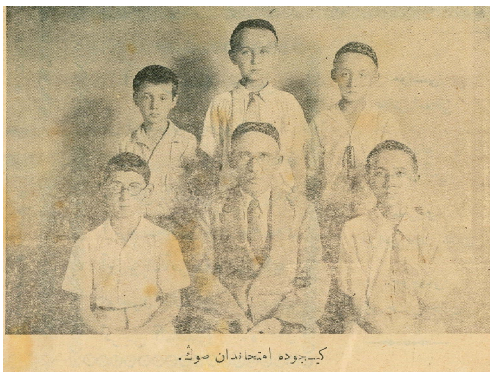
Рәс. 2. Кижуда имтиханнан соң.