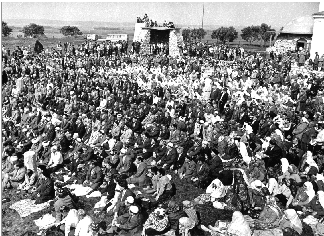
Празднование 1100-летия (по Хиджре) принятия ислама Волжской Булгарией. Торжественный намаз на остатках Соборной мечети. 1989 г. Болгарский музей-заповедник. КП 493/108-31.

О татарских паломниках в Болгарах пишет одно из популярных в конце XIX – начале XX вв. изданий из серии «Путеводитель» – «Приволжские города и селения в Казанской губернии»: «Около малого минарета есть огороженное четырехугольное пространство, здесь, по преданию татар, погребены магометанские святые. У этих могил летом и осенью постоянно можно встретить пилигримов – татар, приезжающих сюда даже из Астраханской и Тамбовской губерний» (Приволжские города, 1892: 189).