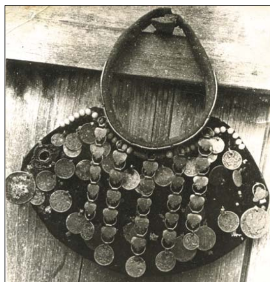
Рис. 9. Нагрудное украшение яка . Кряшены . Д. Малые Ерыклы Нижнекамского р-на ТАССР. Экспедиция 1968 г.

ошейника осталась только та часть, на которую крепились подвески и которая со временем превратилась в застежку.