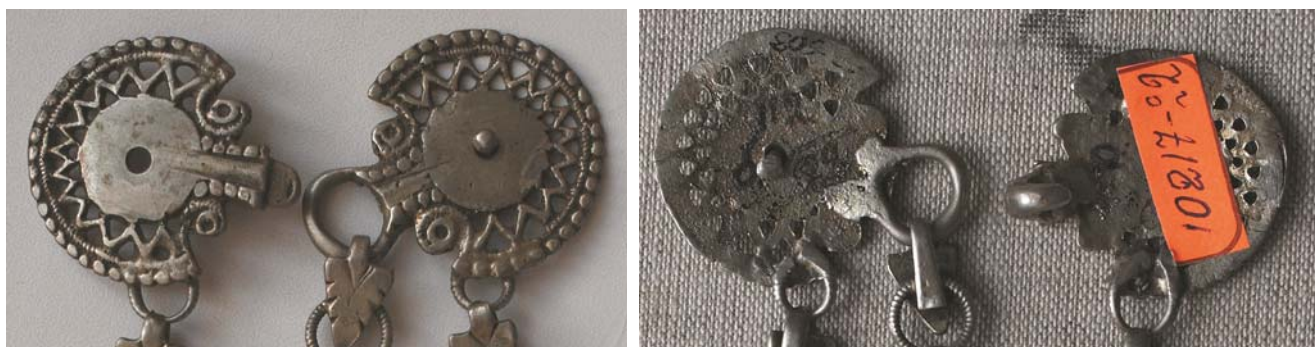
Рис. 25, 25а. Застёжка для камзола (фрагмент). Литьё, позолота. Казанские татары. НМ РТ, инв. 10217-22.