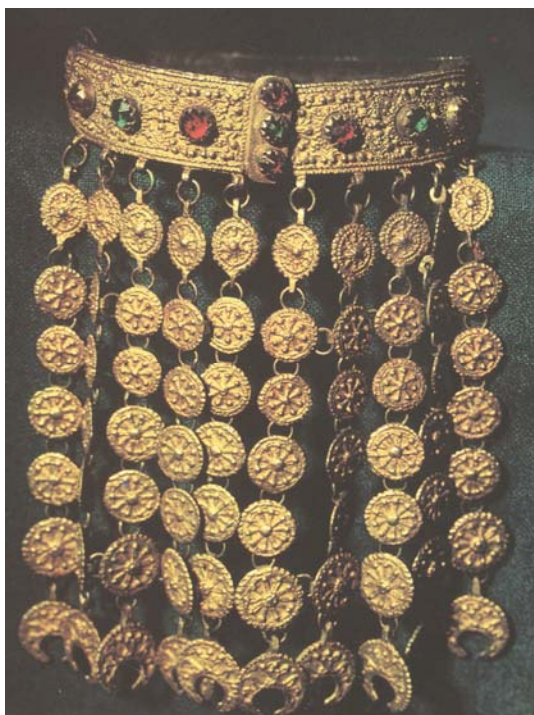
Рис. 6. Гердан. Ожерелье литое бронзовое с позолотой, украшенное цветным стеклом. Софийский округ (Пунтев 1981: 21).