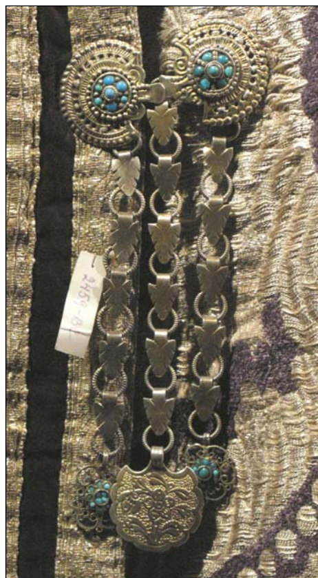
Рис. 16. Литая застежка для камзола в виде личины барана. Экспозиция РЭМ.

Функциональным аналогом, возможно и прообразом татарских застежек в образе личины барана, являются, по нашему предположению, литые кафтанные застежки, известные под названием «ракушки» (рис. 17), «скарабеи» (рис. 18, 19, 20), часто встречающиеся в средневековых материалах центральной России. Они также состоят из двух половин – стилизованных образов жуков-скарабеев или речных ракушек, и также скрепляются между собой особым образом «мама-папа».