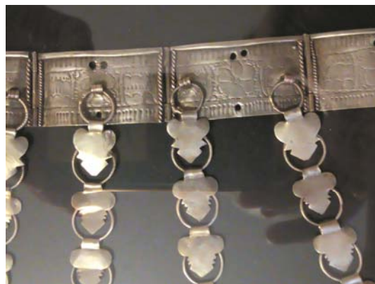
Рис. 8. Яка чылбыры в виде ошейника из металлических пластин. Чеканка, монеты. Кряшены . Казань (частная коллекция).