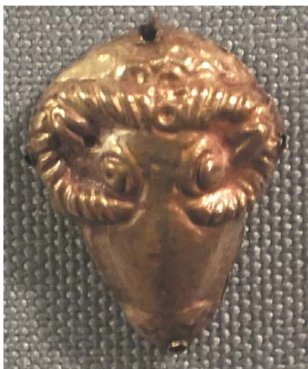
Рис. 14. Личина барана на нашивной бляшке. Золото. Боспорское царство. ГЭ, инв. № ГК/Н.75-80. Экспозиция.