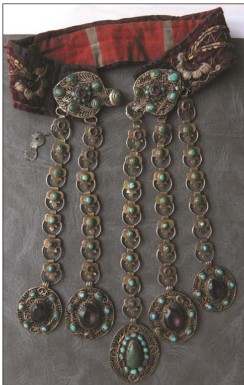
Рис. 1. Яка чылбыры . Серебро, позолота, ажурная филигрань, монеты, самоцветы, бирюза. Казанские татары. XIX в. НМ РТ, инв. 10260-2.

Наиболее распространенный тип этого эффектного шейно-нагрудного украшения представляет собой довольно крупную застежку-пряжку с прикрепленными к ней цепочками с концевыми подвесками, спускающимися до середины груди. Общая длина украшения могла составлять 30–35 см. Такие застежки часто крепились к специальным плотным парчовым воротникам, которые надевались поверх традиционно низкого ворота рубахи кулмак (рис. 1).