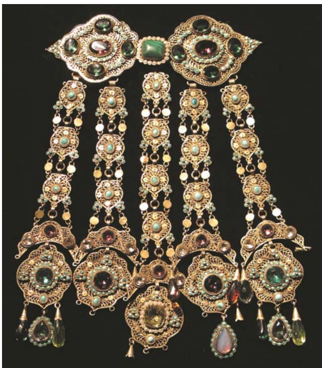
Рис. 2. Яка чылбыры . Серебро, позолота, ажурная филигрань, самоцветы, бирюза. Казанские татары. Середина XIX в. РЭМ, инв. 800 аб-Т (Архив отдела этнографии Института истории АН РТ).