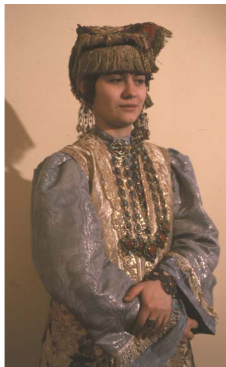
Рис. 3. Яка чылбыры в городском комплексе девичьей одежды. Казанские татары. Середина XIX в. РЭМ (Архив отдела этнографии Института истории АН РТ).