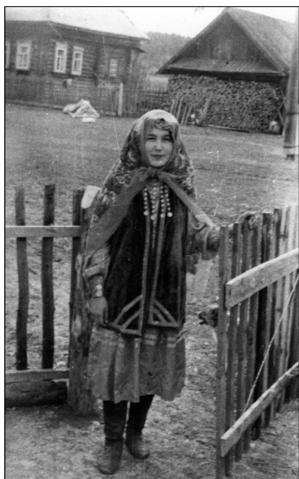
Рис. 4. Яка чылбыры в сельском комплексе девичьей одежды. Д. Баташи, Кунгурского р-на Пермской обл. Пермские татары. Экспедиция 1978 г.