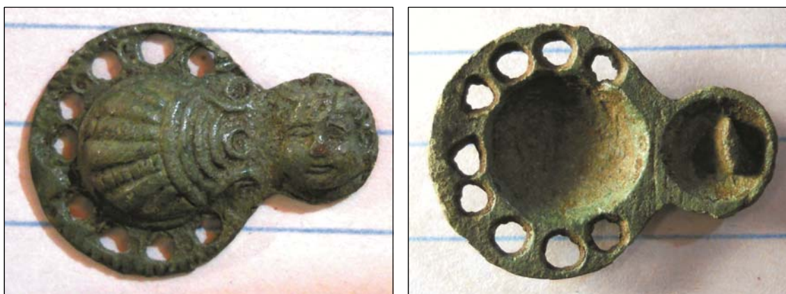
Рис. 19. Кафтанная застёжка (крючок). Литьё, бронза. Источник: URL: https://meshok.net (дата обращения: 05.01.2023).