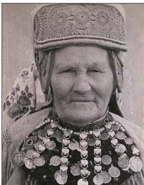
Рис. 10. Кряшенка в нагрудном украшении яка . Д. Малые Ерыклы Нижнекамского р-на ТАССР. Экспедиция 1968 г.

Н.И. Воробьев считал, что этот кряшенский и более архаичный металлический ошейник с нагрудными подвесками является прообразом классического татарского украшения и само его наименование – воротниковая цепочка – соответствует именно ему. Впоследствии украшение потеряло связь со своим названием, получив вид лишь воротниковой застежки с подвесками (Воробьев, 1953: 298). Завершающий этап формирования яка чылбыры вероятно связан с заменой металлического более комфортным тканевым или позументным воротником. От металлического