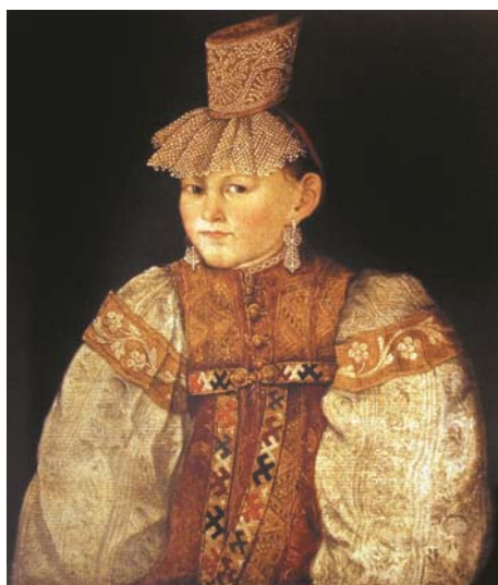
Рис. 22. Застежка «скарабей» в традиционной русской одежде (Купеческий 2013: 74).