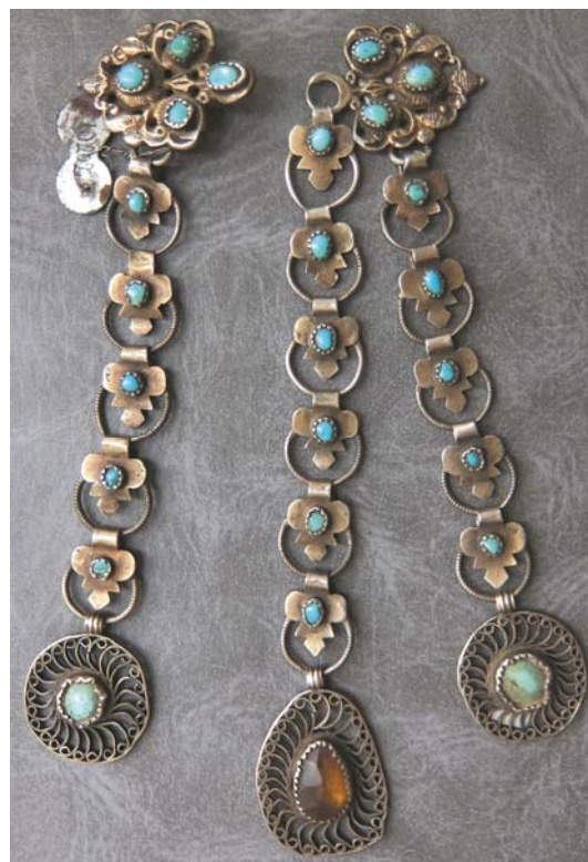
Рис. 29. Воротниковая застёжка яка чылбыры . Серебро, позолота, монеты. Литые. Казанские татары. НМ РТ, инв. 10217-57.

Подводя итог изложенным в публикации историко-этнографическим сюжетам можем высказать гипотезу о сложном пути формирования этноспецифического и во