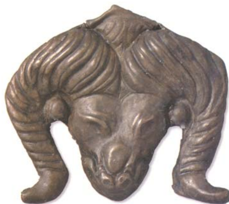
Рис. 15. Бляха. Личина барана. Серебряная гора. Монголы (I в. до н.э. – I в. н.э.) (Хааны Эзэнт гүрэн 2018: 135).

Миниатюрные литые застежки для камзола в образе стилизованных личин барана , скрепленных между собой по типу «мама-папа» (петля и крючок) при формально-морфологическом, конструктивном сходстве с яка чылбыры , отличаются от них по технике изготовления и функционально. Они выполняли функцию не столько нагрудных украшений-ожерелий, сколько поясных застежек для женского камзола (рис. 16), а порой и оригинального элемента декора матерчатых украшений. Например, их нашивали на бархатные «карманцы»-амулетницы нагрудного украшения перевязи хаситэ . Классические вариации воротниковых застежек традиционно изготавливались в технике филигранны или чеканки.