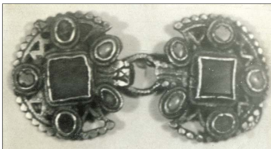
Рис. 26. Застёжка для камзола. Литьё. Сердолик, бирюза. Казанские татары. РЭМ (Архив отдела этнографии Института истории АН РТ).