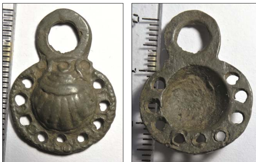
Рис. 18. Кафтанная застёжка «скарабей» (петля). Литьё, бронза.