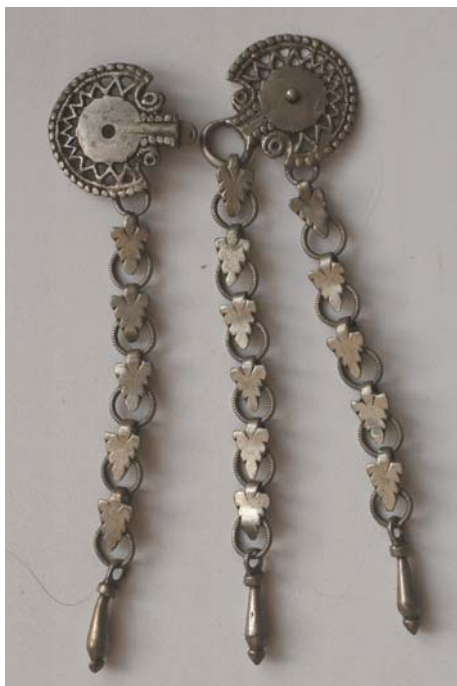
Рис. 12. Поясная застежка со стилизованным изображением личины барана. Серебро, позолота. Литье. Казанские татары. НМ РТ, инв. 10217-22.