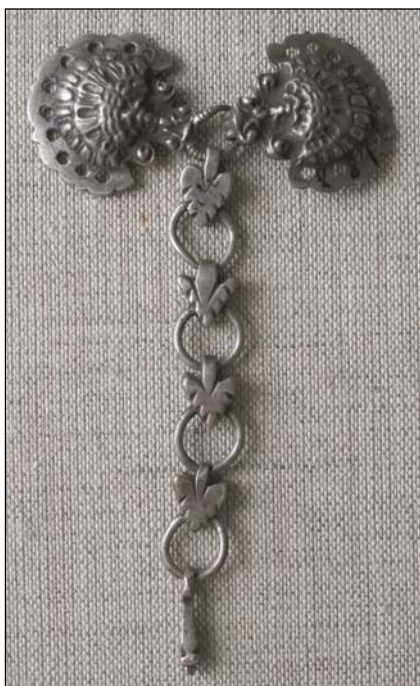
Рис. 11. Поясная застежка со стилизованным изображением личины барана. Серебро. Литье. Казанские татары. НМ РТ, инв. 10217-23.

В ранних татарских материалах имеются миниатюрные (8–13 см) конструктивные аналоги яка чылбыры , выполненные в технике литья. Застежки многих из них напоминают сдвоенные головки баранов (вид сверху – «личина»), выполненные с разной степенью стилизации (рис. 11, 12, 13). Реалистичное и стилизованное изображение барана имеет сложную семантическую нагрузку; оно чрезвычайно характерно для евразийского искусства издревле, особенно для тюрко-монгольских (Сураганов, 2014) и ираноязычных этносов (Вольная, 2016) (рис. 14, 15). В ареал распространения этого образа в Евразии исследователи включают районы по среднему течению Сыр-Дарьи (Таджикистан), Отырарский оазис (Казахстан), Поволжье, Крым, Кавказ, Кубань (Сураганов, 2014: 75). Он в основном встречается на предметах мелкой бронзовой пластики, отлитых по восковой модели. Головы и фигурки животного часто являлись элементами костюма. Встречаются и поясные пряжки в виде бараньих голов (Вольная, 2016: 5–23).