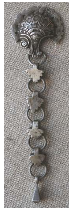
Рис. 13. Поясная застежка со стилизованным изображением личины барана. Серебро. Литье. Татары. НМ РТ, инв. 10217-58.