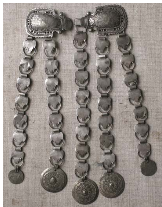
Рис. 30. Воротниковая застёжка яка чылбыры . Серебро. Чеканка. Казанские татары. НМ РТ, инв.10217-31.