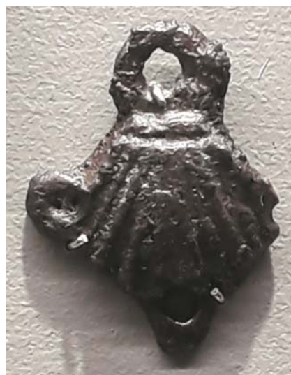
Рис. 23. Застежка ракушка. Литьё. Середина XVII в. «Остров-Град Свяжск», музей дерева. Экспозиция.

В пользу предположения о возможном русском прообразе говорит факт визуального и типологического сходства татарских и русских застежек. В татарских изделиях наблюдается трансформация характерных деталей образа скарабея в элементы, рисующие образ барана, в частности, усики жука превращаются в стилизованные рога (вид парных симметричных спиралей). Заметим, что выдающийся тюрколог, специалист по проблемам истории и культуры кочевников Евразии С.И. Вайнштейн мотив парных спиралей относит к раннекочевническому историко-генетическому слою (Вайнштейн, 1974: 155). Мотив спаренных спиралей (второй орнаментальный комплекс по Валееву) характерен для татарского народного декоративно-прикладного искусства, как и для болгарского орнамента (Валеев, 1969: 132). Русский след прослеживается и на характере подвесок. Так, ранние вариации татарских застежек нередко сопровождаются подвесками гирьками . Так называемые гирьки , выполнявшиеся различными ювелирными техниками, представляют собой характерный элемент русского костюма (пуговицы, подвески серег и др.). В татарских украшениях использовались подвески из блях или монет. Декоративное оформление русских и татарских застежек этого типа также было различным. Оно выполнялось в духе своих собственных художественных предпочтений; у татар они часто украшались бирюзой. Русские кафтанные застежки не сопровождались подвесками.