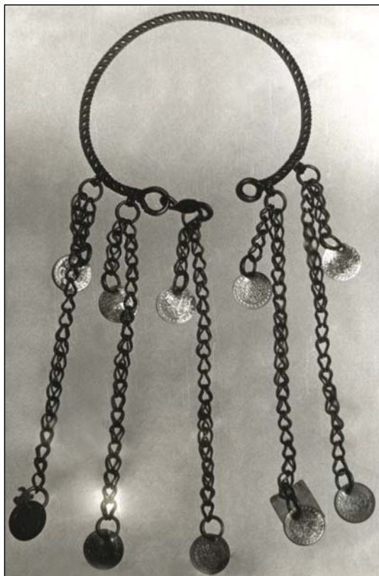
Рис. 7. Гривна с подвесками. Татары. РЭМ, инв. 25406.

Некоторые исследователи прослеживают в образе яка чылбыры среднеазиатское влияние (Гаген-Торн, 1960: 96). Позволим себе не согласиться с этим мнением. В просмотренных нами многочисленных коллекциях среднеазиатских музеев обнаружено только одно подобное украшение (Ташкент, музей искусств Узбекистана, инв. 7/17), которое использовалось, кстати, не по назначению – не как шейно-нагрудное, а как поясная пряжка багыч . Оно представляет собой полную аналогию казанско-татарскому яка чылбыры по форме, по технике и по характеру инкрустации драгоценными камнями. Синхронные этнографические параллели находим в аналогичном женском украшении гердан из Дунайской Болгарии (рис. 6), этнокультурная история которой связана, как известно, с волжскими булгарами (Пунтев, 1981). Некоторая восточная помпезность в облике гердан и отдельных вариантов татарских яка чылбыры не исключает влияния ювелирных традиций Османской империи на искусство не только подвластной ей Болгарии (Етнография, 1983: 113–117), но и единоверцев – татар.