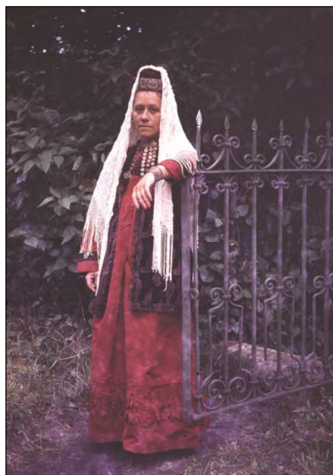
Рис. 5. Яка чылбыры в городском костюме. Касимовские татары. Историко-краеведческий музей г. Касимова. Экспедиция 1985 г.