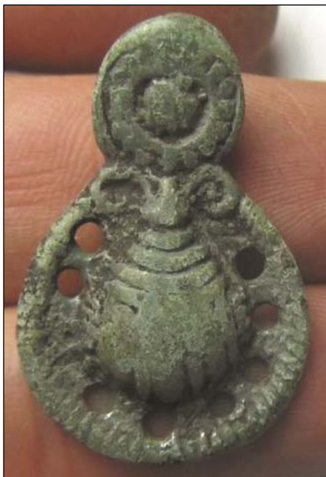
Рис. 20. Кафтанная застёжка (крючок). Литьё, бронза.