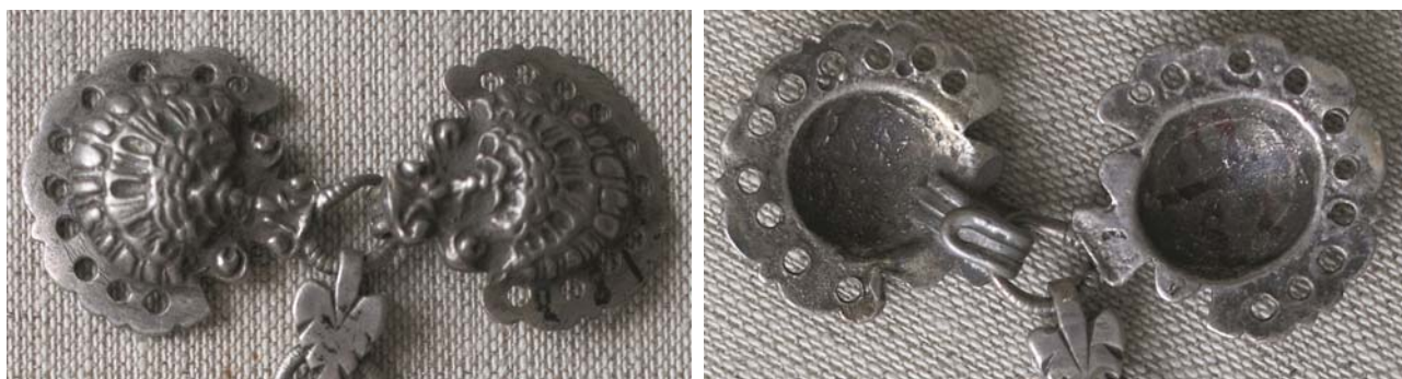
Рис. 24, 24а. Застёжка для камзола (фрагмент). Литые, чернь. Казанские татары. НМ РТ, инв. 10217-23.