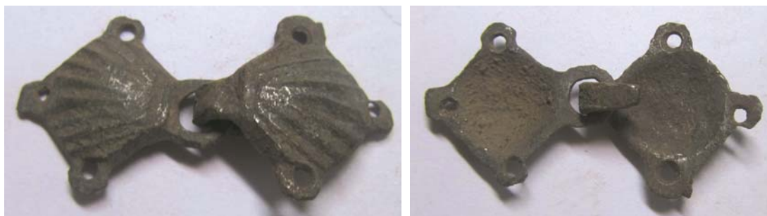
Рис. 17. Кафтанная застёжка «ракушка». Литьё, бронза. Источник: URL: https://meshok.net (дата обращения: 05.01.2023).