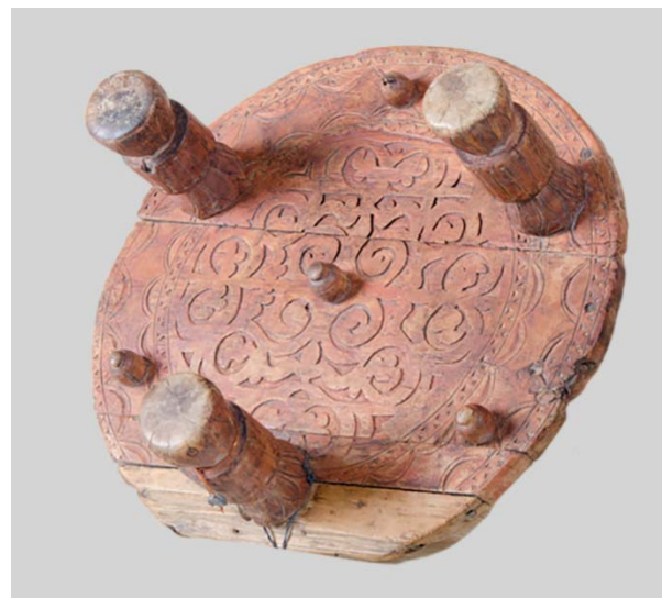
Рис. 4. Астахта . Начало XX в. ГМИ РК им. И.В. Савицкого.