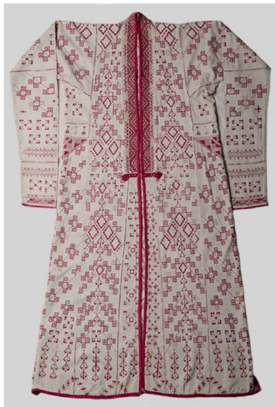
Рис. 3. Ақ жезде . Первая четверть XX в. ГМИ РК им. И.В. Савицкого.

В ГМИ им. И.В. Савицкого хранятся интересные экспонаты – предметы гигиены. Они были найдены во время археологических и этнографических исследований на территории Каракалпакстана в течении XX столетия. Среди них имеются такие предметы, как мәсиуек – палочка для чистки полости рта, тарақ – расческа для волос, тис