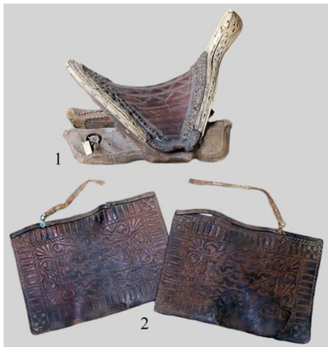
Рис. 1. Элементы конского снаряжения – ак баслы ер (1), тебинги (2). Начало XX в. ГМИ РК

Украшенная ювелирными накладками сбруя целиком называется алақайыс жууен , т.е. сбруя с полосатыми ремнями. Она состоит из нагрудника си-немент , подхвостника қуйыскан и самой сбруи жууен . В музейных коллекциях очень мало полных комплектов сбруи и других ременных поясов с ювелирными украшениями.