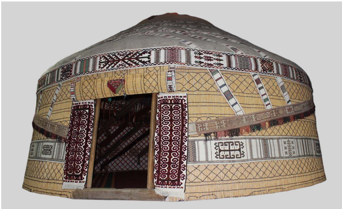
Рис. 2. Юрта в экспозиционном зале. ГМИ РК им. И.В. Савицкого.

Юрта представляет собой круглое в плане разборное жилище, состоящее из деревянных, тканых, плетенных и войлочных частей. Остов юрты сүүек басы составляют решетчатые раздвижные стенки кереге , состоящие из отдельных звеньев канат , купольных жердей уўық , верхнего круга шаңарақ , дверцы ергенек . Сверху деревянный остов покрыт войлоком, а по бокам – циновкой в два слоя, одна из циновок украшается переплетёнными цветными шерстяными нитями и называется жез ший . Система покрытия каракалпакской юрты резко отличается от юрт соседних народов обилием употребляемых циновок и малым количеством войлока ( кошма ). Конструкция шаңарақ является ярким отличительным элементом этнической принадлежности владельца юрты. У каракалпакской юрты он состоит из двух деревянных ободов – табан , соединенных пикообразными шпильками (Глеубергенова, 1995; 1996). В юрте не должно быть случайных вещей, это древний закон единства функциональности и красоты. Так, у каракалпаков каждая тканая узорная дорожка юрты, украшая её, служит для практического скрепления каркаса и покрытия. Дорожками стягивают решетку стенки и спицы свода, фиксируют циновку покрытия стенки ший и войлок кровли кийиз .