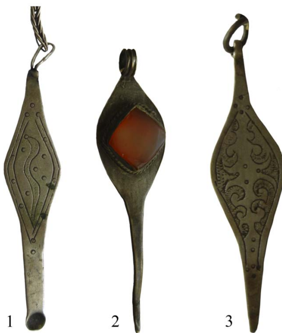
Рис. 5. Копоушка, зубочистка. ГМИ РК им. И.В. Савицкого. Конец XIX в.

К сожалению, документация по большинству экспонатов неполная, отсутствуют сведения о наименовании предмета, его функциональном назначении, районе бытования и месте приобретения. Это серьезно затрудняет исследование музейных коллекций.