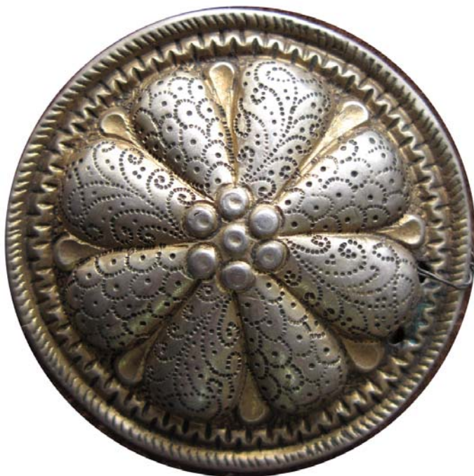
Илл. 6. Бляха. Тиснение, чеканка, серебро, позолота. Размер: 5,0 см. Вес: 8,28 гр. НМРТ, № 10221-113.

Вторая группа высокорельефных блях отличается особой эстетикой. Все они имеют округлую форму и большой полый объём, который также создавался разными способами формования – тиснением, выколоткой и чеканкой. Сюжетом их формообразующего декора выступает раскрытый цветок типа ромашки из шести-восьми, редко – пяти, двенадцати лепестков. Они изготовлены из тонкого листового низкопробного серебра, размером 4,2–5,8 см, весом 3,2–6,5 гр.