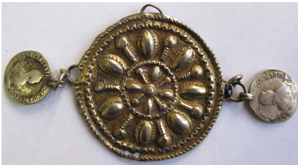
Илл. 7. Бляха. Выколотка по матрице, чеканка, серебро, позолота, монеты. Размер: 5,3 Вес: 14,82 гр. НМРТ, № 10221-117.

Реже встречаются бляхи, рельеф которых изготовлен выколоткой по матрице с барельефным или контррельефным изображением раскрытого цветка. Об этом свидетельствует разница в чёткости оттиска на лицевой или изнаночной стороне (илл. 7). Очевидно её визуальное сходство с дисковидными матрицами X в., которые позволяли имитировать популярный геометрический узор, ритм которого составляли ряды крупной зерни (илл. 2).