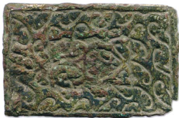
Илл. 3. Матрица. Рыбная Слобода. НМРТ, № 13181.

Технологию «выколотки по матрицам» на рубеже XIX–XX вв. стали использовать кустари Рыбной слободы, причём матрицы могли быть весьма ранними (илл. 3). В.Гильд описывает процесс следующим образом: «На чурбан набивают железную бабку, а на неё рисунок, сделанный мастером. Нарезав из листовой жести узенькие полоски, накладывают на бабку, придерживают палочкой и молотком выбивают узор, ударяя по полоске». Чаще таким образом изготавливались незамкнутые браслеты, декор которых состоял из чередующихся рядов растительного и геометрического орнамента. В день мастер мог изготовить до пятисот таких браслетов (Гильдт, 1913: 6). Чеканные изделия изготавливались на вывоз в Казахстан и Среднюю Азию. Стремясь удовлетворить активный спрос, купцы вывозили с этих территорий готовые матрицы (Воробьев, Бусыгин, 1957: 18).