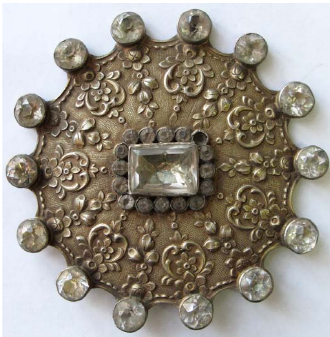
Илл. 5. Бляха. Чеканка, серебро, позолота, хрусталь. Вес: 49,5 гр. НМРТ, № 10221-161.

На этом фоне заметно выделяются бляхи с барельефом, выпукло-вогнутый объём которого создавался последовательно, для чего заготовка переворачивалась неоднократно (илл. 5). Применялись чеканы с различными формами бойков и опорные подкладки, позволяющие варьировать объём, жёсткость, мягкость форм и контуров рельефа. Стилистическое их отличие обусловлено использованием иного комплекса мотивов с преобладанием спирально загнутых стеблей с отростками. Центрально-лучевая композиция этих украшений требовала предварительной прорисовки отдельного сложносоставного раппорта – повторяющегося базового элемента, расчёта и построения с учётом формы. Свидетельством тому – нанесённые канфарником реперные точки орнамента и вычерченные линии