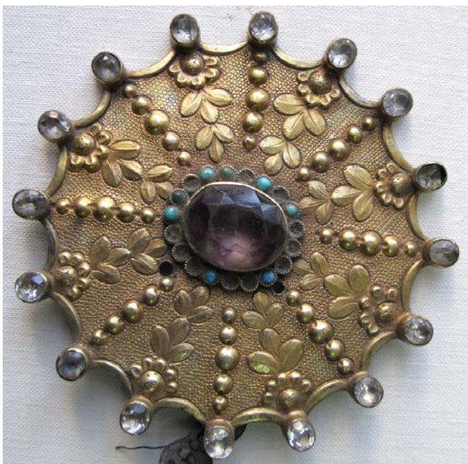
Илл. 4. Бляха. Чеканка, серебро, позолота, аметист, бирюза, хрусталь. Размер: 8,6 см. Вес: 36,8 г. НМРТ, № 10221-341.

Несмотря на общую эстетику композиционного пространства фестончатых и розетчатых блях, барельеф создавался различными по степени сложности технологическими приёмами. Преобладает пунсонный орнамент (илл. 4). Терминологическое определение соответствует наименованию основного инструмента. Пунсон является разновидностью чеканов и представляет собой металлический стержень с фигурным бойком, без прижимного поля. Его следы, имеющие листовидную, округлую (пурошник) или каплевидную форму бойка, служили своеобразными модулями, из которых составлялись однотипные мотивы раскрытых и полураскрытых цветов, условно – ромашек из трёх-восьми лепестков. Прямыми и наклонными ударами по пунсону мастер мог варьировать высотой отдельных элементов и даже ракурсом цветка. С лицевой стороны рельеф оттенялся зерновой фактурой фона, силуэт «листочков» подчёркивался обводкой.