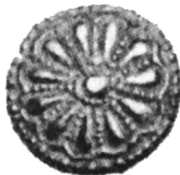
Илл. 2. Дисквидная матрица с розетчатым раппортом и имитацией зерни. Начало X в. Из раскопок в Булгаре и Билярском городище. ГИМ, инв. № 34851, 5427, 8834 (Полякова, 1996: 164, рис. 59-1).