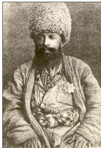
Фото 4. Матмурад-Деванбеги. Хивинский музей-заповедник «Ичан-Кале».

Матмурад-Деванбеги (он же – Мухаммад-Мурад-Деванбеги Шейх-Назар-Есаулбаши-Оглы) (фото 4) родился в 1830 г. в Хиве, в Дишон-кале, в семье крупного сановника Хивинского ханства Шейх-Назара-Есаулбаши Мухаммад-Мурад-оглы, военного министра ханства. Сам Матмурад был крупным политическим, общественным и военным деятелем Хивинского ханства XIX в., одним из крупнейших землевладельцев (владел 50 тыс. танапов, т.е. 20,5 тыс. га земель) (Юлдашев, 1957: 202–205; Погорельский, 1984: 28; ЦГА РУз. Ф. И–2. Оп.1. Д. 291. Л. 103) и коннозаводчиков Хивы, главным сановником периода Мухаммад Рахим-хан II (1864–1910) в сане деванбеги (премьер-министра) (Худойбергганов, 2008: 157, 160).