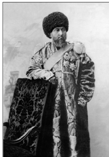
Фото 3. Мухаммад Рахим-хан II. Хивинский музей-заповедник «Ичан-Кале».

Мухаммад Рахим-хан II был просвещённым монархом, известным поэтом и композитором. Он стремился к развитию придворной свиты через культурные достижения. Так, он требовал, чтобы вечера музыки соответствовали высокому уровню музыкального искусства. Именно при нём в Хорезме была написана первая нотная запись музыки. Поэтическим творчеством при дворе начали заниматься десятки интеллектуалов, которые одновременно сочетали в себе поэтов, каллиграфов, переводчиков, историков. Поэтические произведения писали более 30 поэтов. Ими руководил Мухаммад Рахим-хан. Собственные стихи он подписывал поэтическим псевдонимом Фируз и во многом подражал творчеству Алишера Навои. Все его окружение писало на староузбекском языке и также подражало творчеству Навои. Почти каждый из придворных поэтов написал собственные поэтические сборники ( диван ). Создание дивана являлось показателем того, что поэт достиг мастерства, стал зрелым мастером. Это было важным условием для Мухаммад Рахим-хана II, который заботился об усилении придворной поэтической среды. Дворцовый поэт Камил Хорезми писал, что при Мухаммад Рахим-хане II поэты были удостоены должного внимания.